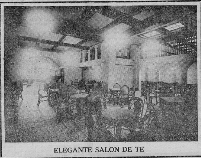
ELEGANTE SALON DE TE

El mensaje del presidente de Venezuela dice así: "La inauguración del servicio cablegráfico directo entre Venezuela y Colombia, uniendo Maracaibo y Barranquilla, centros de tanta importancia y brillante futuro, contribuye, como he tenido oportunidad de expresar a Vuestra Excelencia, a estrechar de un modo efectivo las relaciones entre nuestros dos países. Tengo gran placer en corresponder al expresivo mensaje de Vuestra Excelencia ofreciendo mis congratulaciones por el establecimiento de este nuevo lazo entre dos naciones ya tan estrechamente enlazadas por la historia y por razones espirituales. Aprovecho la oportunidad para reiterar a Vuestra Excelencia mis deseos por su bienestar personal y por la continuada prosperidad de esta nación hermana. — Juan Bautista Pérez".